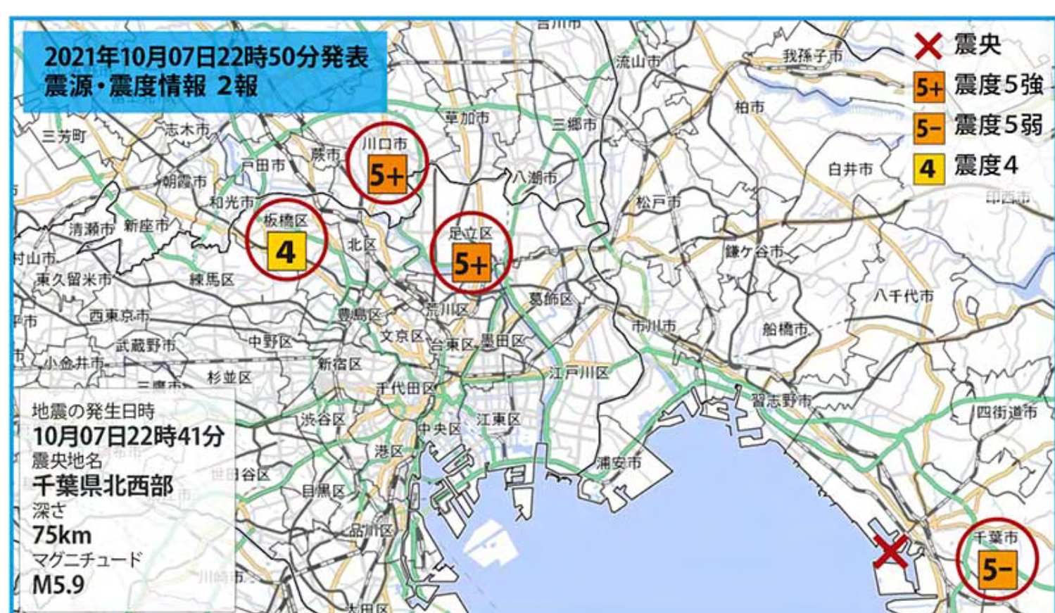
(気象庁、地震情報をもとに当社で編集作図)

10月7日夜、首都圏に10年ぶりの震度5強の地震発生。 三誠AIR断震システムを装備した多くのお客様から、 「しっかり浮上し、揺れを感じない！」 の連絡をいただきました。